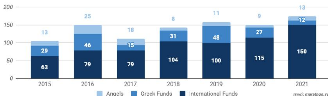
Εικόνα 3: Αριθμός επενδύσεων ανά πηγή σε startups Ελλήνων επενδυτών

Το επιχειρηματικό κεφάλαιο αναγνωρίζεται ευρέως ως ένα από τα πιο συμβατικά μέσα για την απόκτηση χρηματοδοτικών πόρων. Οι επενδυτές συνεισφέρουν οικονομικούς πόρους και προσφέρουν συμβουλές στην επιχείρηση με αντάλλαγμα μετοχές ιδιοκτησίας. Συνήθως, η χρηματοδότηση επιτυγχάνεται με την αύξηση του μετοχικού κεφαλαίου, χωρίς τη συμμετοχή των υφιστάμενων μετόχων. Αυτοί οι επενδυτές συνήθως συμμετέχουν στο Διοικητικό Συμβούλιο (ΔΣ) της εταιρείας, μοιράζοντας τις γνώσεις και τις δεξιότητές τους για να βοηθήσουν την εταιρεία να επεκταθεί. Παρέχουν κεφάλαια για την επικοινωνία, την έρευνα και ανάπτυξη και άλλους τομείς επενδύσεων. Ο πρωταρχικός στόχος των ιδιοκτητών και των επενδυτών κινδύνου είναι να δημιουργήσουν μια άκρως ανταγωνιστική εταιρεία στην αγορά, αποφέροντας έτσι κέρδη και για τα δύο εμπλεκόμενα μέρη. Η έκθεση της Marathon Venture Capital αποκαλύπτει ότι το 2021, τα ξένα κεφάλαια κυριάρχησαν στην επενδυτική δραστηριότητα για τις ελληνικές Startups, αντιπροσωπεύοντας το 86% του συνόλου των επενδυτικών γύρων, όπως απεικονίζεται στο διπλανό σχήμα (Jeonget. al., 2020).